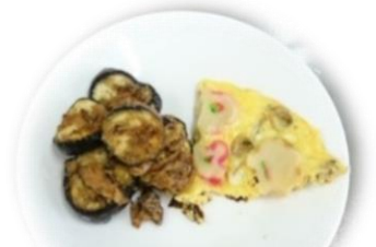
あさりと焼き麩の卵焼き 鯖缶でなす味噌炒め