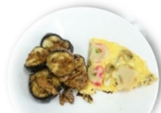
あさりと焼き麩の卵焼き 鯖缶でなす味噌炒め