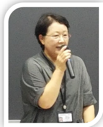
本日のお話は分かりやすかったですか